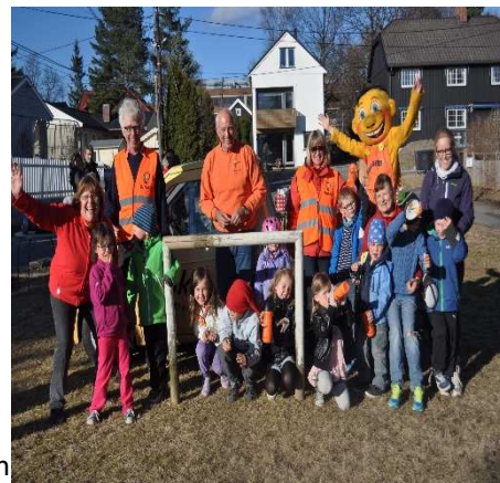
Rusken i mai

Vårt område ligger nord i bydelen Grünerløkka. Her jobber vi sammen for å skape et trivelig og trygt bomiljø. Jubileumsåret har vært preget av hyggelige aktiviteter for alle. På Rusken i mai fikk vi besøk av Rusken-generalen og maskotten, og Hasle skole musikkorps spilte i gatene.